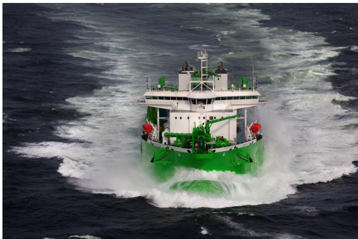
La drague autoporteuse suceuse DEME 'Congo River'

DEME est l'actionnaire principal de CTOW; copropriétaires sont Multiship et Herbosch Kiere.